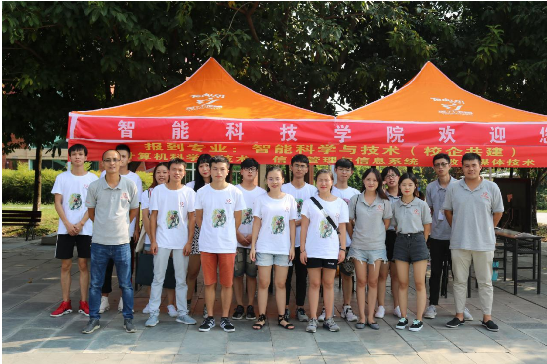
人工智能学院部分专业学生合影

加拿大 McMaster 大学电子与计算机工程学院博士研究生，2019 年于华中科技大学获控制工程硕士学位，曾在网易公司任 AI 算法工程师。目前研究方向为机器学习，深度学习和计算机视觉。目前主要参与机器学习的课程研发工作。