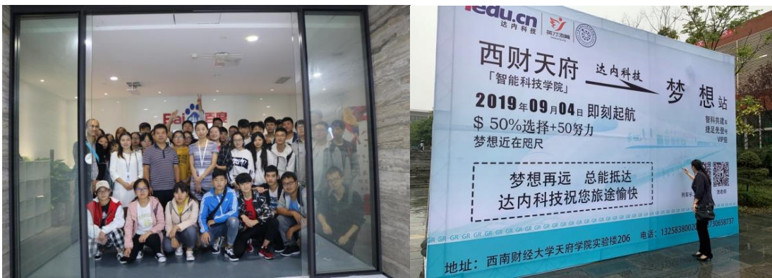
新生报到及专业认知实习 参观一流互联网科技企业