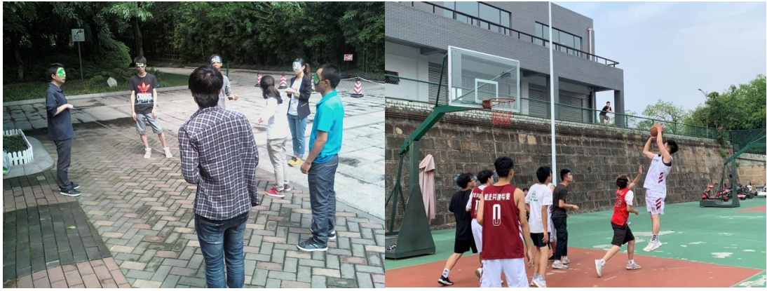
学生丰富的课余活动及拓展训练